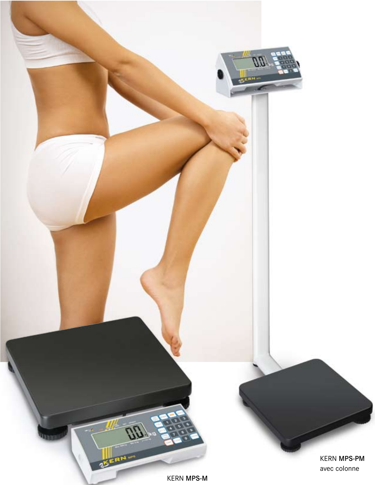
KERN MPS-M avec afficheur autonome

Pèse-personne homologué avec fonction IMC